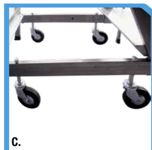
A. Versione CCBR/A B. Versione CCBR/MA C. Versione CCBR/AA