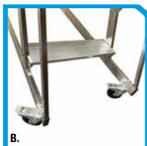
A. Particolare doppio pianerottolo B. Ruote piroettanti con freno

* Nel numero di gradini sono conteggiati anche i pianerottoli Le misure sono espresse in mm